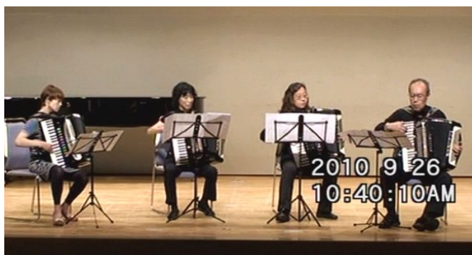
出場番号 8. アミーゴ 弦楽四重奏曲「アメリカ」より第3楽章 作曲：ドヴォルザーク