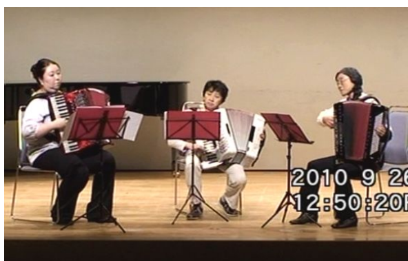
出場番号 26. 金曜の風 「縦の木」 作曲：シベリウス 編曲：中山英雄