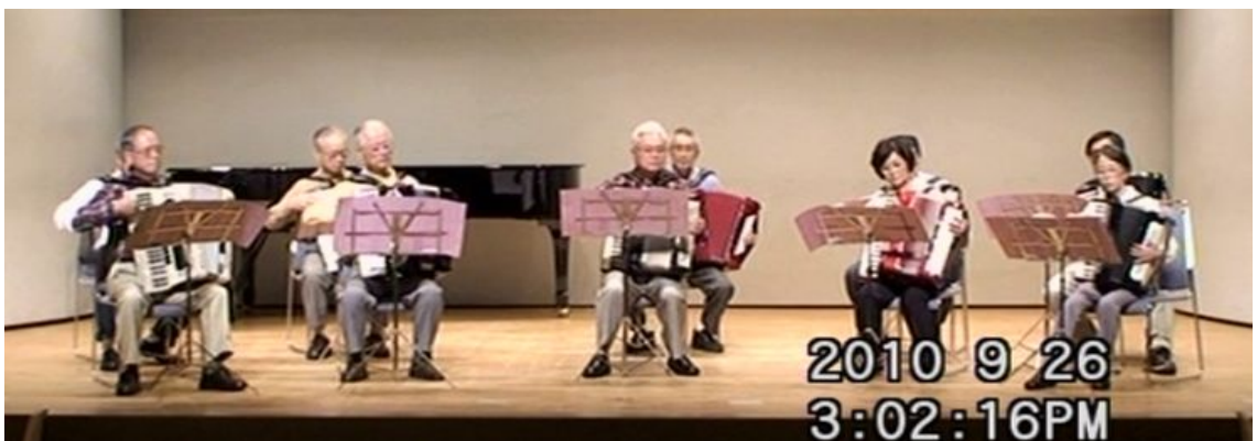
出場番号 3. 横浜アコーディオン愛好会 「別れのブルース」 作曲：服部良一 編曲：石井庸介