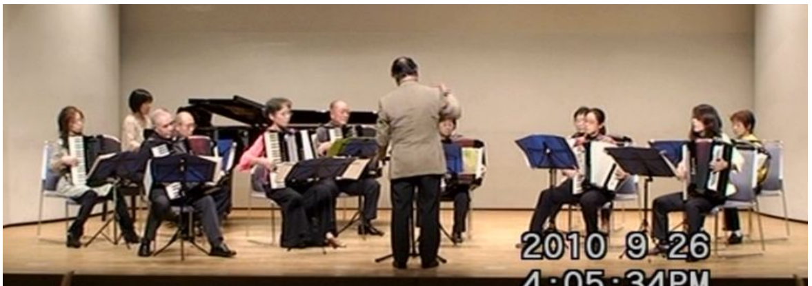
出場番号 11. 音楽センター東部教室 TONIGHTO「ウェストサイドストーリー」より 作曲：バーンスタイン 編曲：木下そんき