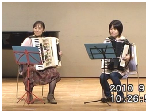
出場番号 5. チーム新宿 「CHARLIE THE BOXER」 作曲：STANLEY KARANKOWSKI