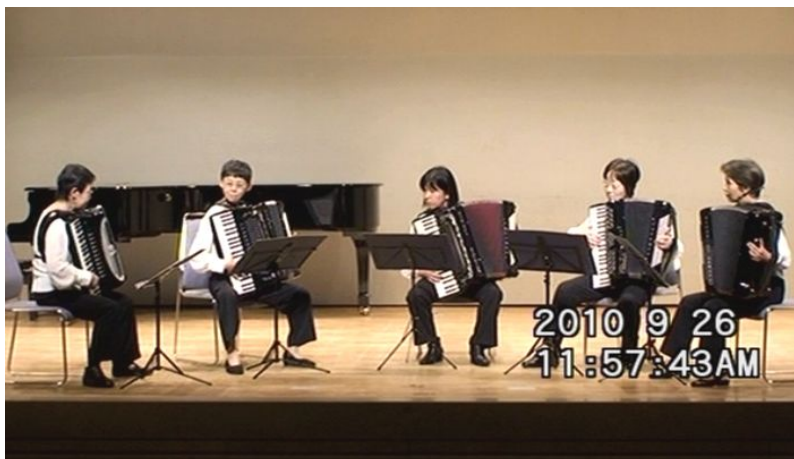
出場番号 18. ニュー・アンサンブル・アコルデ 「ユーモレスク〜冬」 作曲：ヤン・トゥルーラー