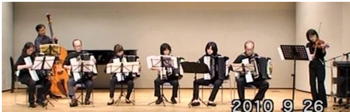
出場番号 3. アミーゴ「タンガリア」 作曲：リチャール・ガリアーノ 編曲：橋本千香子