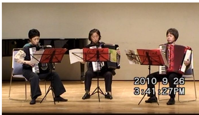
出場番号 8. ウィンドバスカーズ川口 「サンバメドレー」 作曲: アリー・バローゾ 編曲: 松永勇次