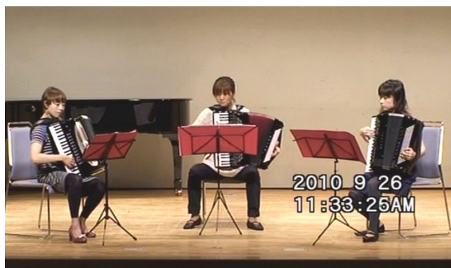
出場番号 14. 土曜の女子会 「The Easy Winners」 作曲：スコット・ジョプリン