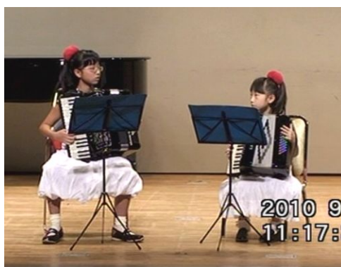
出場番号 13. 東京アコーディオン文化クラブ (たまことシスターズ)「森へ行きましょう」 作曲：ポーランド民謡 編曲：Xi-An Yu