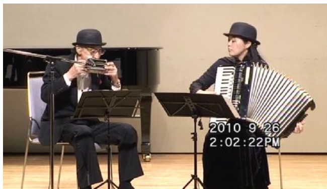
出場番号 1. accornica 「Corazon de Oro」 作曲：Francisco Canaro 編曲：関田更如