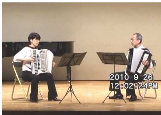
出場番号 19. nero e bianco 「哀愁のミュゼット」 作曲：桑山哲也