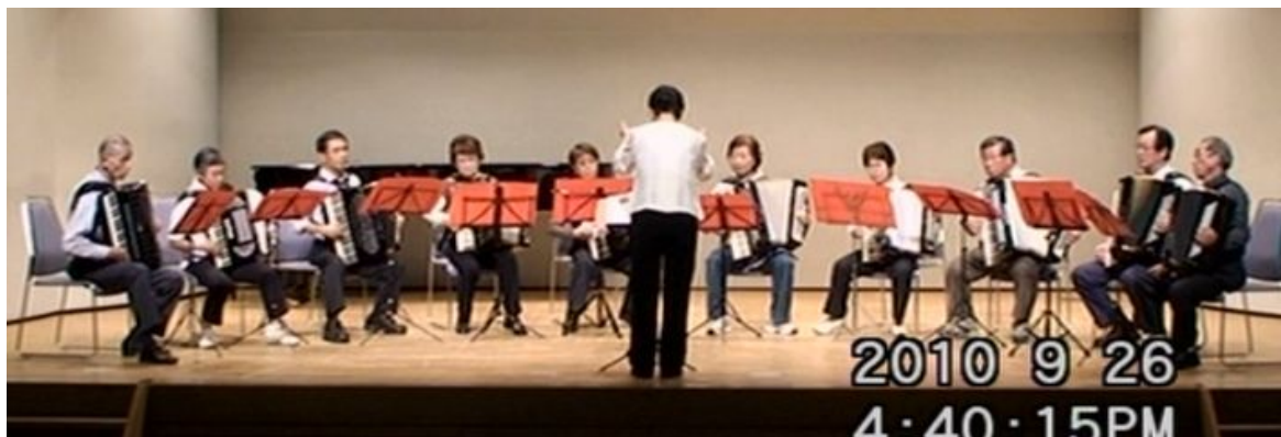
出場番号 16. 音楽センター南部教室 「荒城の月」 作曲: 滝廉太郎 編曲: 松永勇次