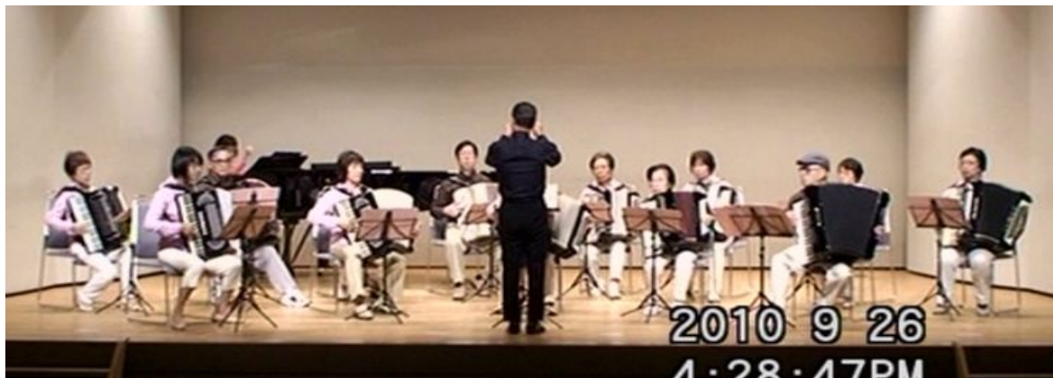
出場番号 14. 東京労音アコーディオン研究会 「薔薇色のメヌエット」 作曲：ポール・モーリア 編曲：浜名政昭