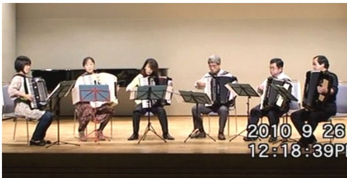
出場番号 21. アコーディオン・カルパッチョ東部 「トリッチ・トラッチ・ポルカ」 作曲：J・シュトラウス 編曲：木下そんき