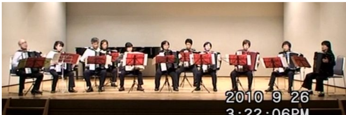
出場番号 6. ウィンドバスカーズ埼玉アコーディオングループ 「荒城の月（ジャズフィーリング）」 作曲：滝廉太郎 編曲：松永勇次