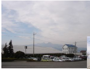
練習会場より榛名山を望む